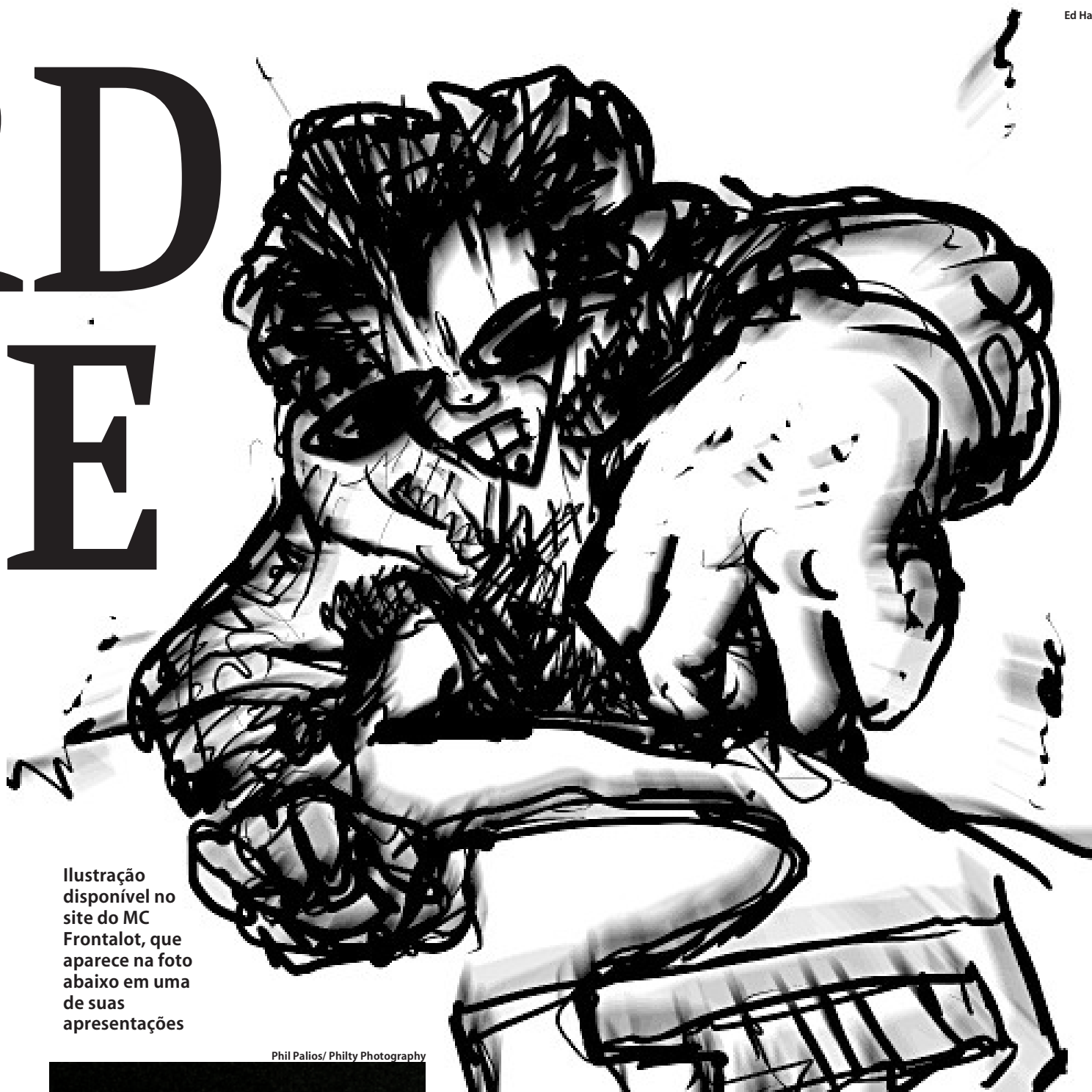
Ilustração disponível no site do MC Frontalot, que aparece na foto abaixo em uma de suas apresentações